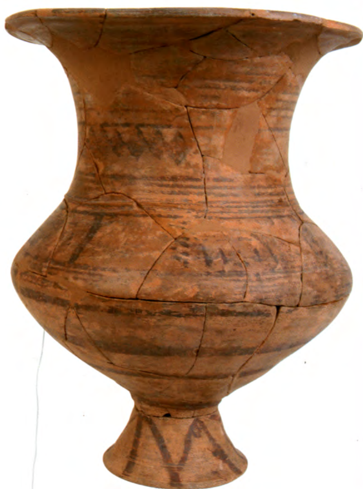
Urna N.º inv.: 1976/40/2 Cerámica 29 x 26 ó cm finales s. v-inicios s. iv a. de C. Museo Arqueológico Nacional, Madrid