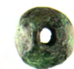
N.º inv.: 1976/40/15