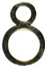
N.º inv.: 1976/40/19