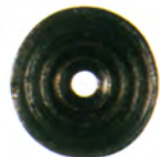
N.º inv.: 1976/40/15