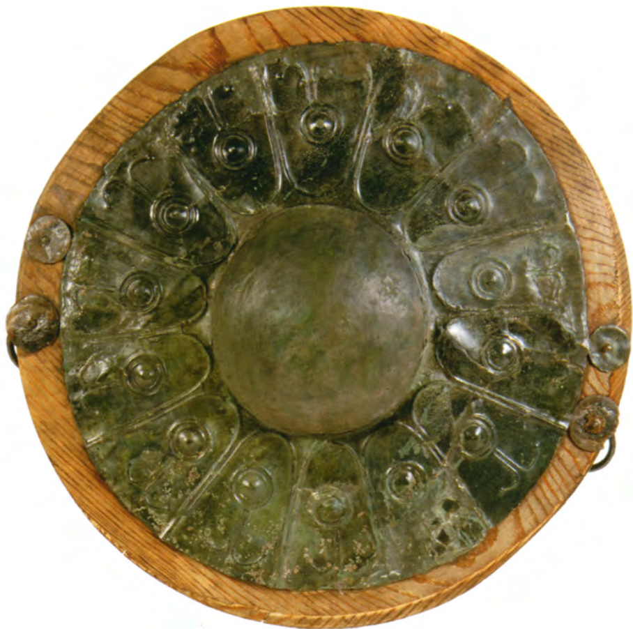
Escudo. N.º inv.: 1976/40/1 Bronce y hierro sobre madera 14 x 30,5 0 x 0,1 cm Finales s. V-inicios s. IV a. de C. Museo Arqueológico Nacional, Madrid